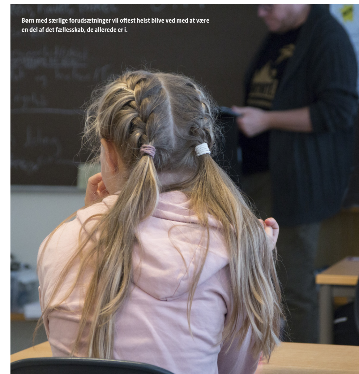
Børn med særlige forudsætninger vil oftest helst blive ved med at være en del af det fællesskab, de allerede er i.

Børn med særlige forudsætninger (BMSF) – Videnscenter Gentofte tilbyder rådgivning, støtte og vejledning til skolerne og forældre, hvis de har et barn med høj begavelse. Du kan kontakte Videnscentret på mail janx1546@gskoler.dk , hvis du har et barn med høj begavelse og har brug for rådgivning. ■